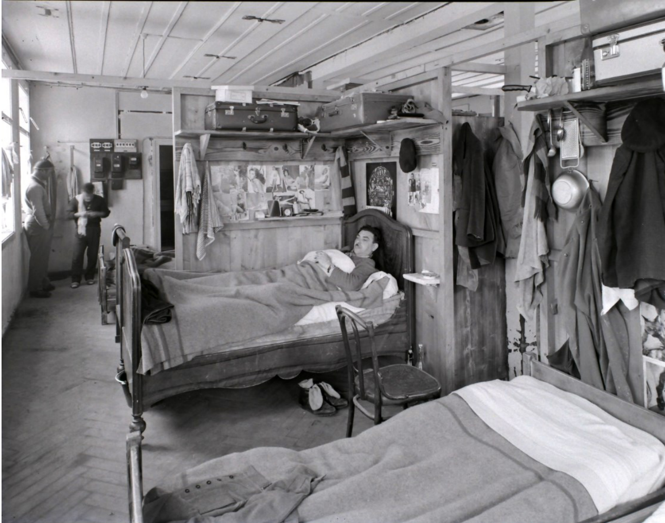
FS_Raess_0069_Gastarbeiter, Reportage Auftrag Holzgewerbeverband